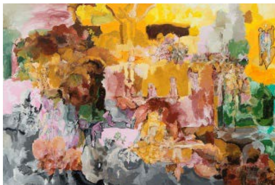
Composición 86-I (Konposizioa 86-I), 1986 Kutxa Fundazioa

Berriz ere olio-pinturara. 1985-1986. urteak. 1985. urtean, Balerdi berriro hasi zen olio-pintura erabiltzen, eta horrekin, bere lanaren azken epealdiari ekin zion, 1992. urtera arte iraun zuena, hil zenera arte. 1985. urtean eta hurrengo udaldietan Donostian egindako margolanen izenak, salbuespen gutxi batzuekin, Composición (Konposizioa) eta egikaritze-urtea ziren. Hasiera batean, azken klarionen antzekotasun handia zuten; nola euren formatu horizontalagatik, hala plano txikiekin osatutako konposizioagatik. Formatuari esker, paisaiaren ideiak toki handiagoa hartu zuen, eta, horrenbestez, olio-margolanetan ostertza agertzea ere ohiko bihurtu zen.