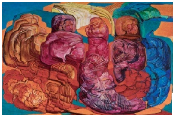
Los gigantes (Erraldoiak), 1972 Bilduma partikularra

Forma klistalizatuak. 1972-1974. urteak. Balerdik hasiera batean Madrilen egin zituen margolan informalistak forma kristalizatuko obra bihurtu ziren, sarri askotan kolore indartsukoak. Etapa honetako obrak desberdinak dira euren artean, baina mundu txukun, trinko eta itxi bat sortzeko desira bakarraren baitan daude eratuak, ausazko orbanen eta keinu-zeinuen bilakaeraren bidez.